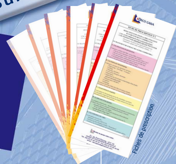
Fiches de prescription